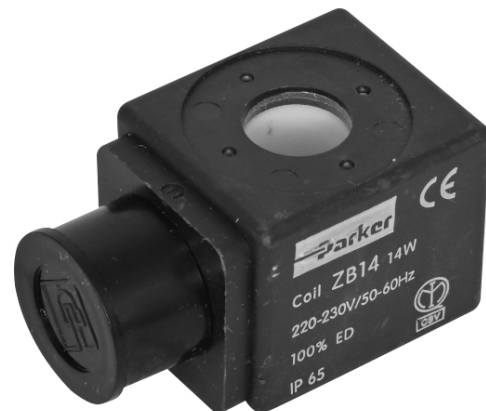
ZB14 / ZB16