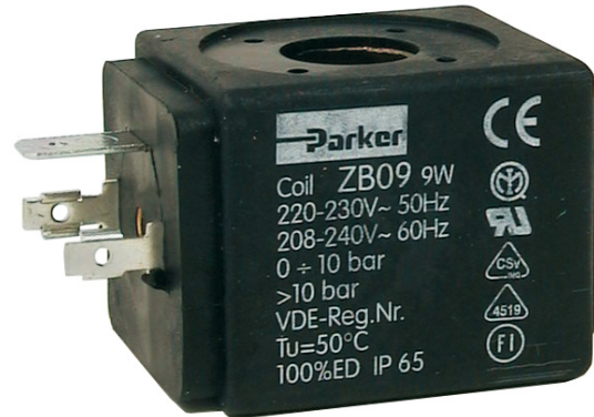
ZB09 / ZB12