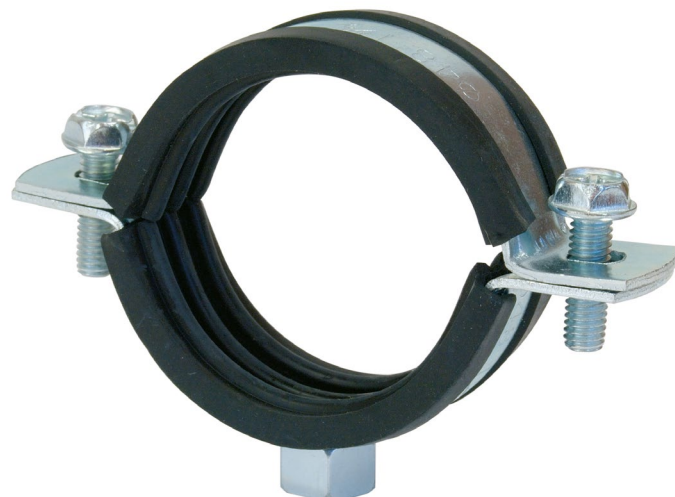
Códigos: AF17021 _ AF17037