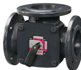
Válvula hierro fundido