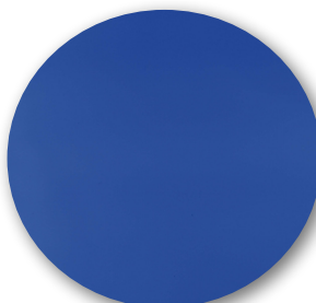
Doble capa PVC