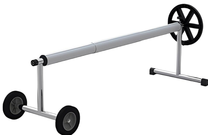
Enrollador telescópico para cobertores