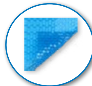
Geobubble 400 \mu