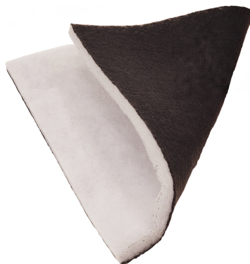
Código: KF08030 (Recambio)