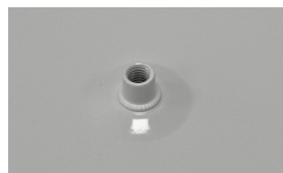
Toma manguera inferior