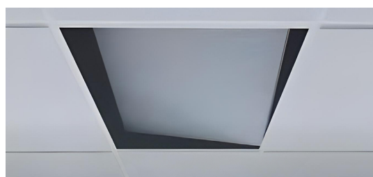
Integrado en falso techo