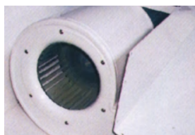
Ventilador centrífugo de alta capacidad.