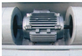
Motor de doble eje.