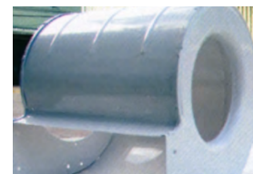
Carcasa del ventilador metálica.