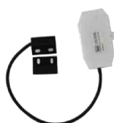
Contacto de puerta (EC06191)