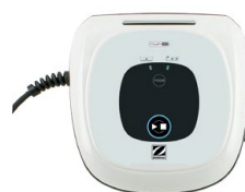
Unidad de control