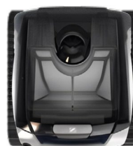
Tapa transparente y filtro retroiluminado