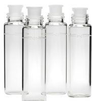
Cubetas de recambio