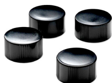
Tapas para cubetas