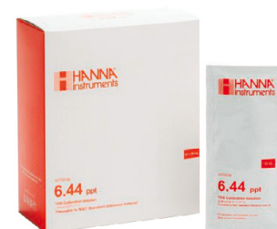
Soluciones calibración TDS