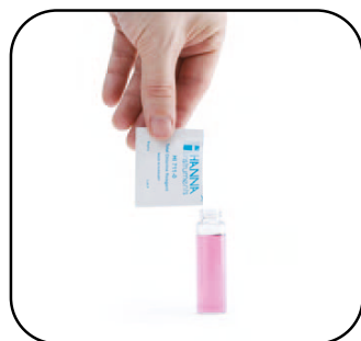
2. Añadir el reactivo en polvo o líquido a la muestra de agua