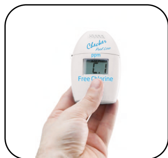
1. Poner a 0 el checker con la muestra de agua