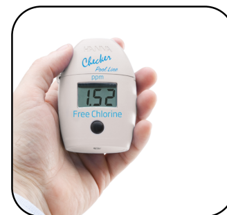
4. Presionar el botón y leer los resultados