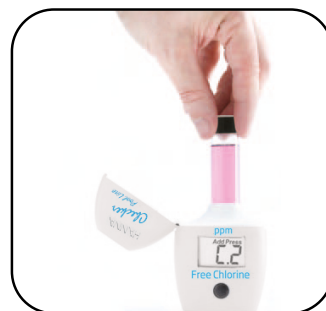
3. Introducir el tubo de vidrio en el checker