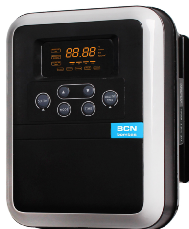
iSMARTVAR 10.5 MT