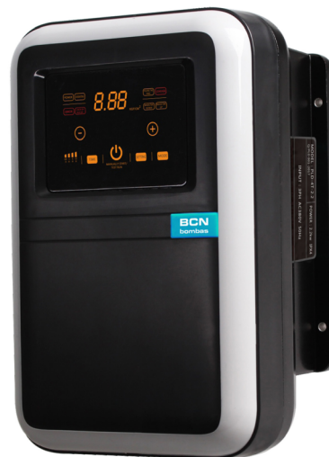
iSMARTVAR 5.7 TT