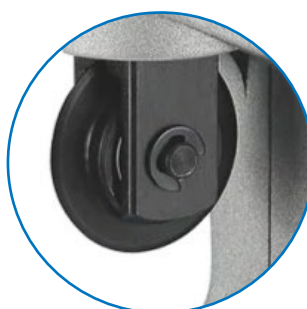
Cuchilla de acero alta calidad