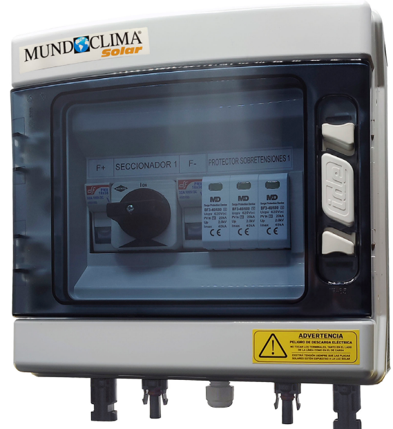
Código: SF 13 011

Esta serie de protectores para sistemas fotovoltaicos tienen como finalidad proteger contra sobrecorrientes y sobretensiones producidas por impactos de rayos en la parte continua de instalaciones generadoras de energía fotovoltaica de corriente continua de hasta 600Vcc