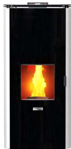
Código: CE 16 481-483