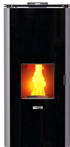
Código: CE 16 480-482