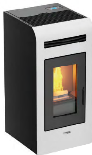
Código: CE 16 461