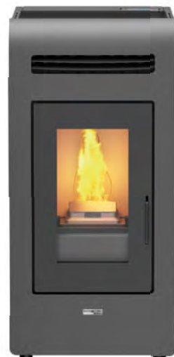
Código: CE 16 460