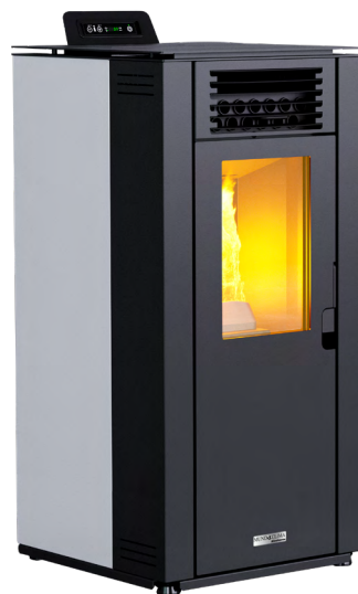
Código: CE 16 443