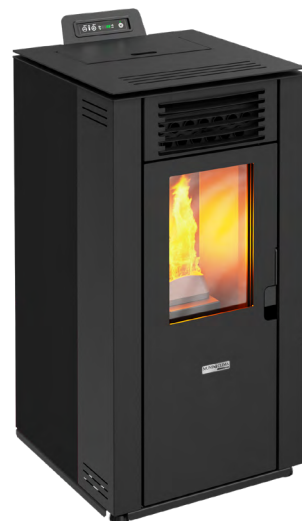
Código: CE 16 442