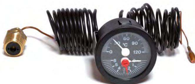
IM 06 028

Termomanómetro con bulbo sensor dilatación a líquido, dos escalas en una misma esfera en donde podemos visualizar en un mismo aparato dos magnitudes, temperatura y presión.