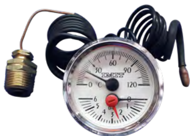
IM 06 026