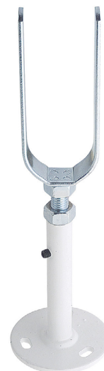
Código: AC 03 259