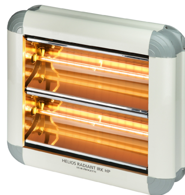
Código: EC 07 284 - EC 07 285