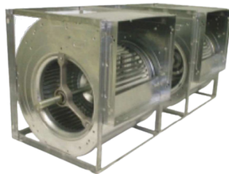
Cód: VE 04 141_150

Bajo pedido se pueden suministrar con motor y transmisión; para ello debe indicarse la potencia del motor requerida y las revoluciones del rodete deseadas.