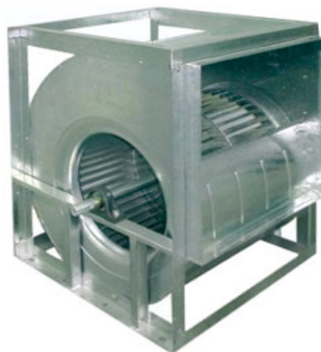
Cód: VE 04 124_VE 04 128

Bajo pedido se pueden suministrar con motor y transmisión; para ello debe indicarse la potencia del motor requerida y las revoluciones del rodete deseadas.