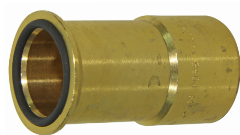
Código: GN 01 042