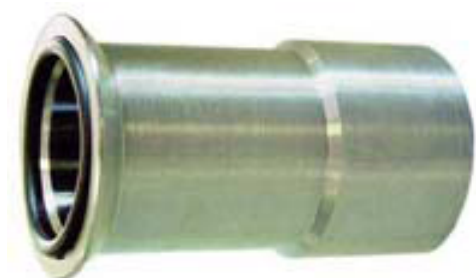
Código: GN 01 039