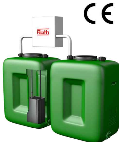
AquaServe 400 con Rothagua RB 700