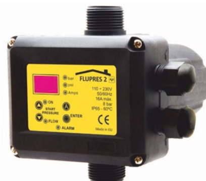
FLUPRES 1 CO 18 537 FLUPRES 2 CO 18 539

FLUPRES es un dispositivo compacto para el control y protección de una bomba monofásica hasta 2,2 kW (3HP). Esta unidad incluye todas las características y funciones de los controladores de bombas tradicionales: sensor de caudal, membrana acumuladora integrada, válvula anti-retorno integrada, indicada de alarma luminosa y un circuito electrónico de control. Tiene además un transmisor de presión interno y un sensor de corriente con lectura instantánea (sólo FLUPRES 2) proporcionado características adicionales: la presión de puesta en marcha puede ser ajustada con alta precisión, dispone de un manómetro digital y protección contra sobreintensidad adaptable para cada electrobomba.