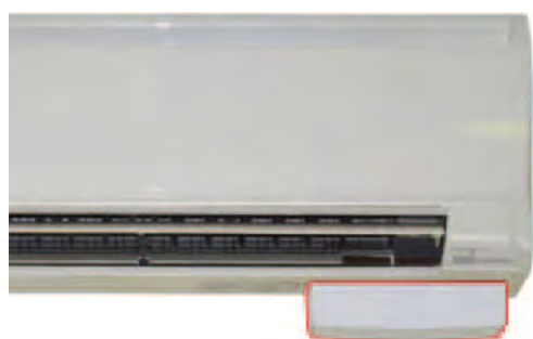
Debajo a la derecha del climatizador