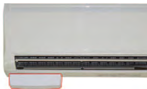
Debajo a la izquierda del climatizador