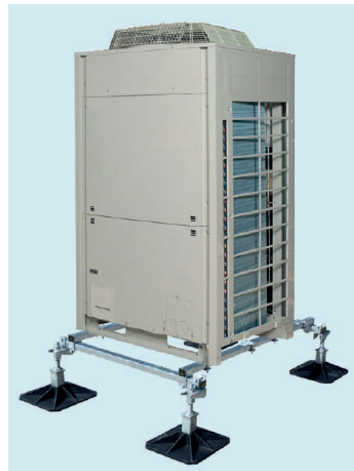
Base y Long Stud Ajuste de altura: 335 - 660mm