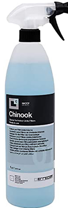
Cód: HF 18 021