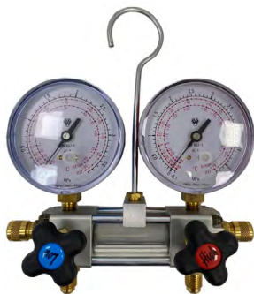
Cod. HF 06 069