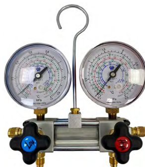
Cod. HF 06 070