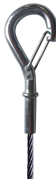
Cód: AF 12 131_136