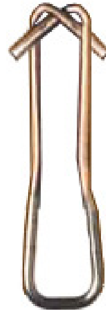
Cód: AF 12 304