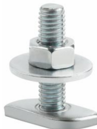
Códigos: CA 12 225 _ CA 12 228