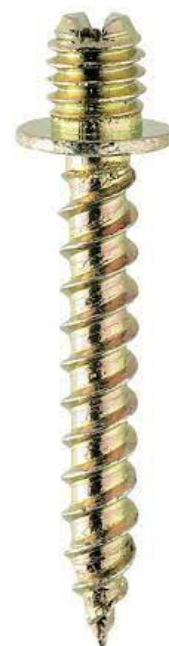
Código: AF 02 301