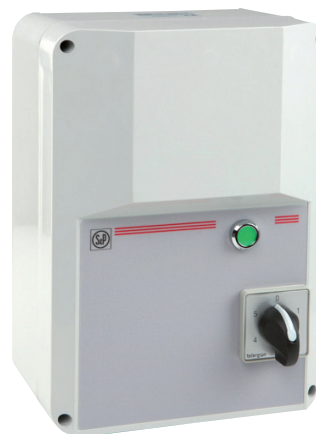
Configuración RMT con caja de ABS