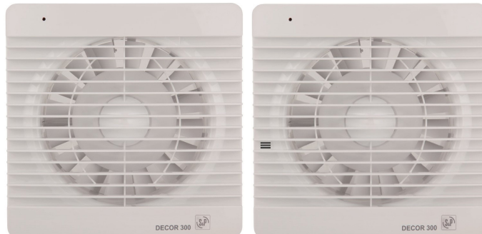
Modelos con humidistato.

Ventiladores helicoidales extraplano, con caudal aproximado de 300 m 3 /h, compuerta antirretorno incorporada, luz piloto de funcionamiento, motor 230 V - 50 Hz, con rodamientos a bolas (modelos Z), IPX4. Clase II, con protector térmico incorporado.