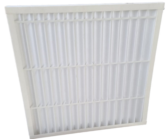
Códigos: KF 90 800 a KF 90 815