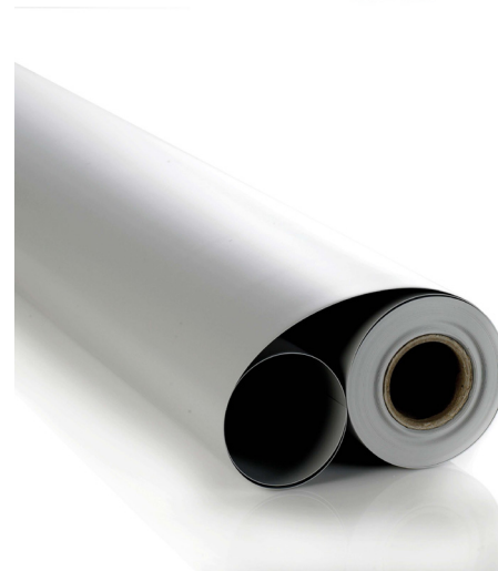
Código: AI 34 002

Una vez colocado el cilindro deseado, puede cerrarse con remaches de PVC o cinta adhesiva.