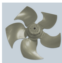
Hélice de alto rendimiento. El especial diseño de la hélice proporciona un gran dardo de aire en exigentes aplicaciones industriales.