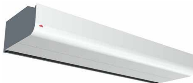
EC20361 _ 363

Las cortinas de aire de Frico generan en los huecos y puertas una barrera invisible que separa las zonas a temperaturas diferentes sin limitar el acceso de personas y vehículos. La tecnología Thermozone genera una barrera de aire muy uniforme, con un equilibrio perfecto entre caudal de aire y velocidad del aire independientemente de si lo que se desea mantener en el interior es calor o frío.