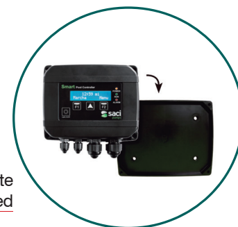
Soporte montaje pared