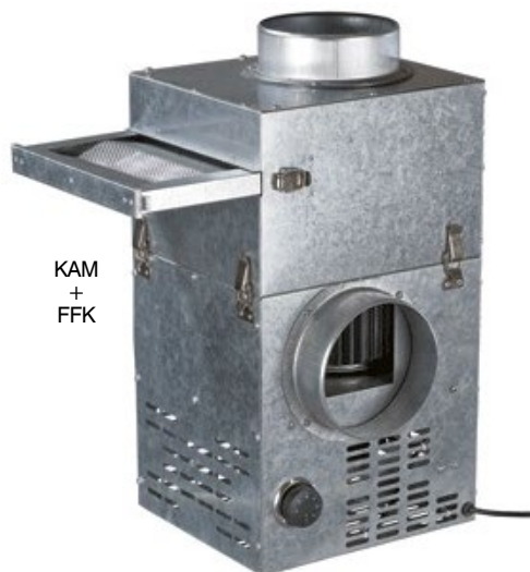
KAM + FFK