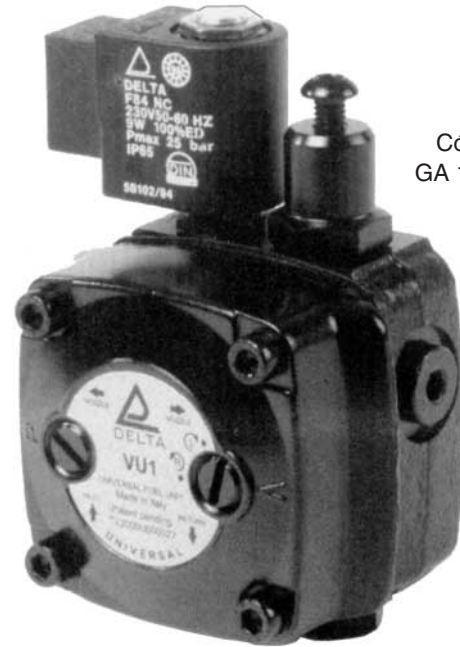
Código GA 15 060

El nuevo regulador de presión , situado en la parte superior de la bomba, permite el ajuste de la presión entre 6 y 18 bar, sin necesidad de substitución del resorte.