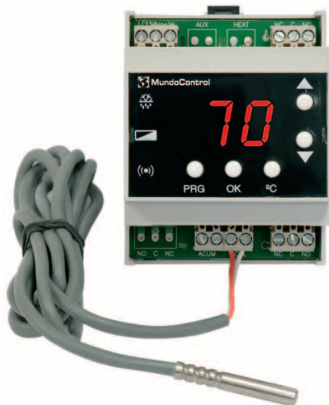
Código: CO 14 660