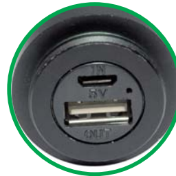
Cargador USB dispositivos móviles Batería litio de 2000mAh

Además de realizar la carga de la batería mediante la célula fotovoltaica incorporada. La linterna solar multiusos ESCOSOL, cuenta con un cargador que se encuentra al desensroscar la parte inferior de la linterna. El tiempo de carga lo muestra la luz indicadora roja. La batería está llena si la luz es roja. Durante el tiempo de carga del teléfono móvil la luz indicadora será azul. Cuando se activa la luz azul intermitente la batería de la linterna es baja. Las luces se apagaran para proteger el estado de la linterna. Mientras esté el intermitente azul aun se podrá usar la linterna durante media hora. Sin embargo disminuirá el 30% del brillo intenso a normal. Es el momento de cargar la linterna.