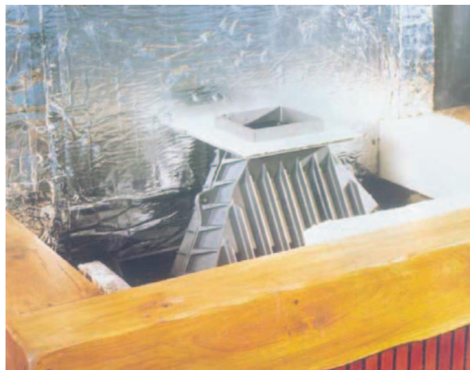
Calorifugado de tuberías, calderas, hornos, equipos.

No corrosivo frente a los metales. Situado en la zona aceptable de la curva de Karnes. Según norma ASTM C-795, C-871.