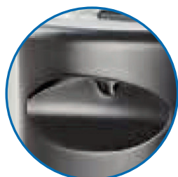
Asa para transporte