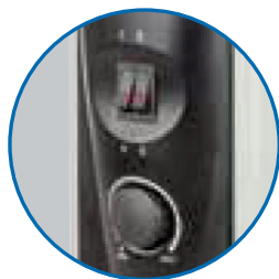
Mandos selectores de potencia y termostato automático regulable. Luces piloto