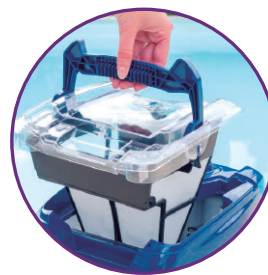
Filtro rígido acceso superior