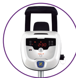
Unidad de control